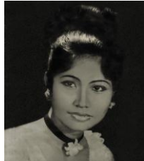
អ្នកចម្រៀង៖ រស់ សេរីសុទ្ធា

ជំនួយបន្ថែមលើផ្នែកផលិតដោយ៖ មជ្ឈមណ្ឌលឯកសារកម្ពុជា